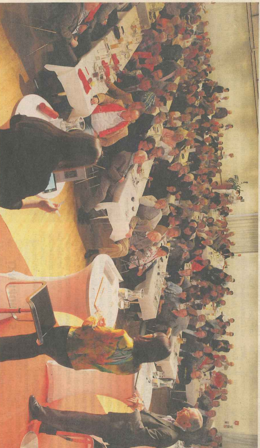
Im Kongresszentrum Saalfelden stellen sich die Chefs der Landesparteien den Fragen der Pinzgauer.

Start. Zur ersten SN-Diskussion zur Landtagswahl kamen etwa 400 Besucher nach Saalfelden