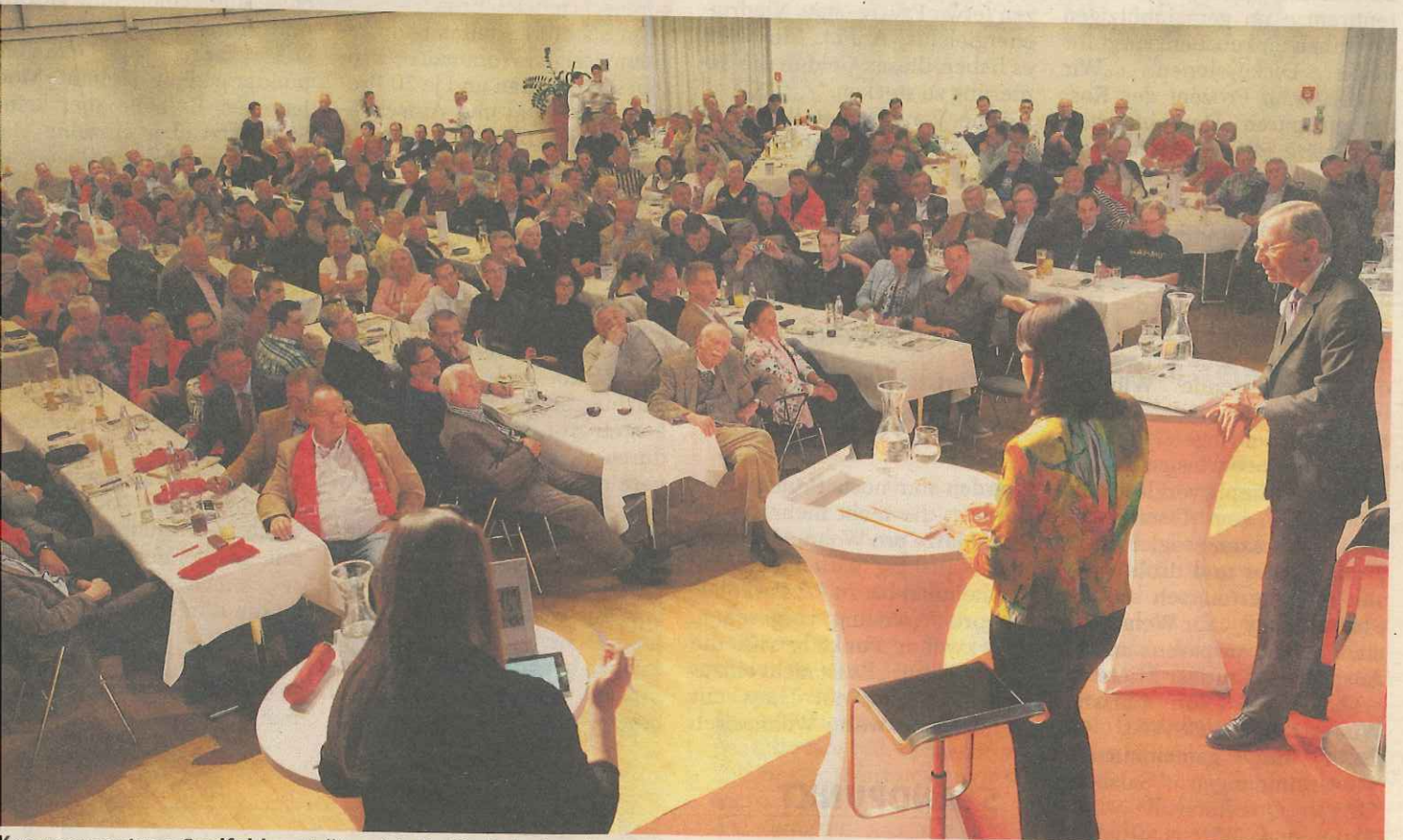
Kongresszentrum Saalfelden stellten sich die Chefs der Landesparteien den Fragen der Pinzgauer.

Start. Zur ersten SN-Diskussion zur Landtagswahl kamen etwa 400 Besucher nach Saalfelden